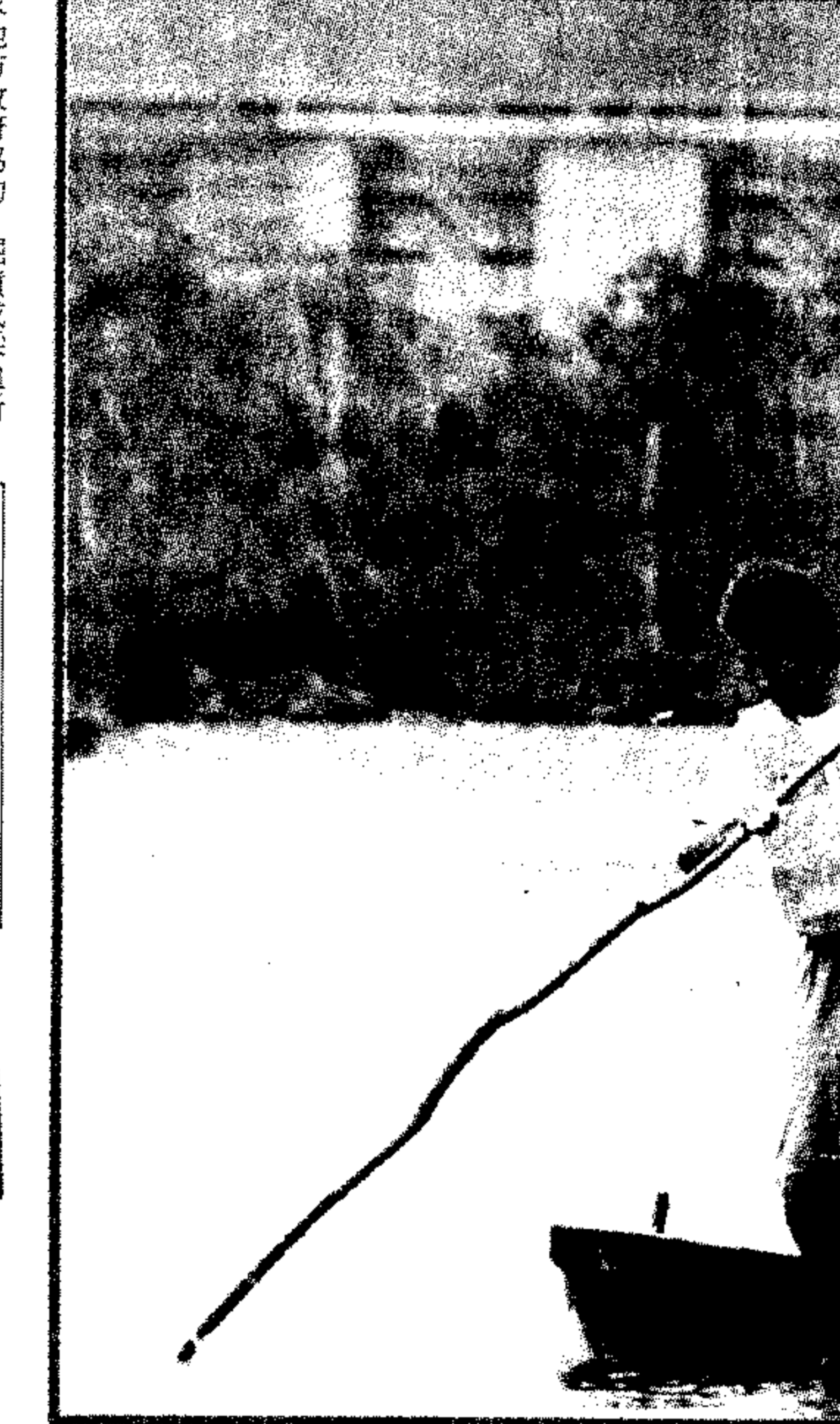
▲何紋貼繡是Ainu衣服的特色。

▲在體格上，Ainu人在現代人類的位置中相當特殊。早在十九世紀中期英國人類學家首先提出Ainu人與高加索種的說法後，陸續有蒙古人種說、南方人種說、古代亞洲人種說等。其中最有名的是小島邦彥教授將日本石器時代出土的古代人骨和Ainu人作比較之後，提出Ainu人與石器時代人類有直接關係的許多類點。在此研究之後，漸漸形成了一個教習場的看法，即是Ainu人乃古代以來日本列島的原始居民，因受到西歐大陸諸族及漢人等外來種的影響，一部分Ainu人與西歐種混血而成為今日之Ainu人，另一部分則被推測到東北，並且北上進入北海道成為今日的Ainu人。