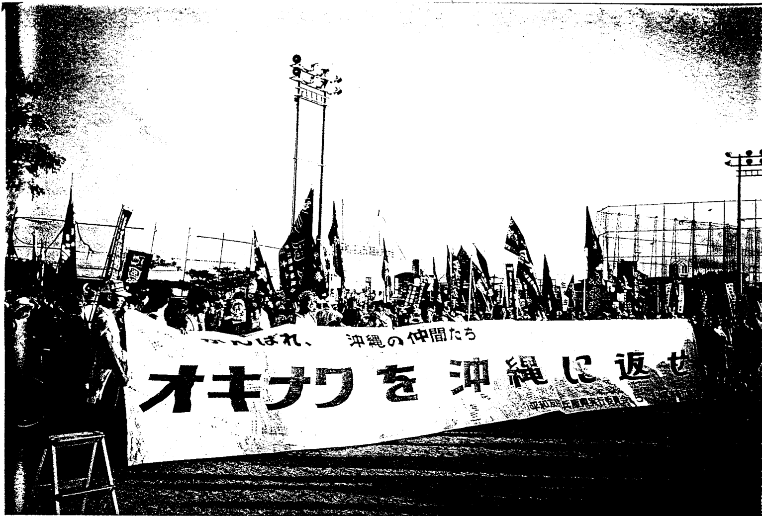
二十五年前復歸日本時所喊的口號是「把沖繩還給日本！」，今年所訴求的口號卻是「把沖繩還給沖繩！」。