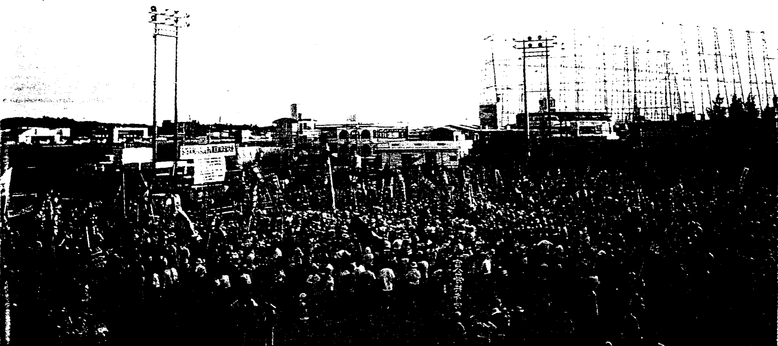
「5・15和平大行進」的遊行隊伍最後在宜野灣市普天間中學操場上大會師。操場的背後緊連著美軍的普天間基地。

到了一九四七年，盟軍制訂了日本新憲法，最高統帥麥克阿瑟也宣佈了沖繩的命運，他說：「沖繩人並不是日本人，所以對於美軍領有沖繩，日本人不至於反對。何況，把沖繩做為美國空軍的基地也保障了日本的安全。」對於這樣的結果，日本果然欣然接受。直到今天，這樣的戰略結構仍舊未變，為了保障日本本土的安全，犧牲沖繩是必要的代價。在這樣的過程中，沒有人問過沖繩人的意見。